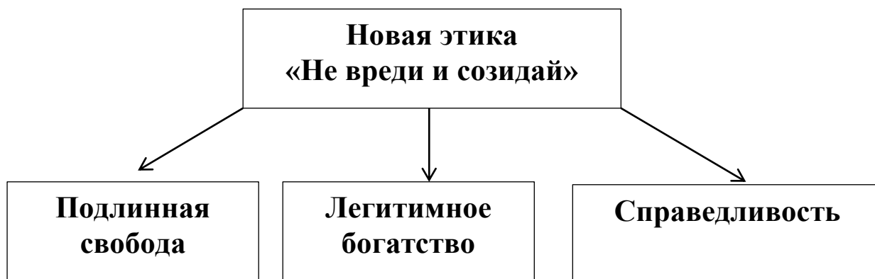
Рис. 2. Результаты смены мировоззренческой парадигмы мышления (переход от Старой к Новой этике).

Только так человек приобретёт подлинную свободу, легитимное богатство и добьётся справедливости в своих делах. Нравственная атмосфера и этика распространится в населенных пунктах, регионах, странах и на всей планете Земля.