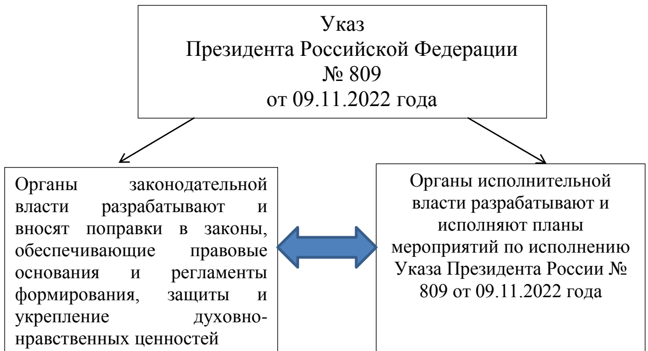
Рис. 3. Исполнение Указа Президента Российской Федерации № 809 от 09.11.2022 года

09 ноября 2022 года Президентом России утверждены Основы государственной политики по сохранению и укреплению традиционных российских духовно-нравственных ценностей. Основы являются документом стратегического планирования в сфере обеспечения национальной безопасности России, определяющим цели, задачи, а также инструменты по защите государством духовно-нравственных ценностей.